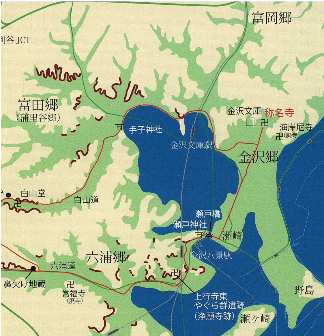
◆ 中世の金沢区(出典:横浜市ふるさと歴史財団) https://www.rekihaku.city.yokohama.jp/cms_files_maibun/pr_brochure/my026.pdf