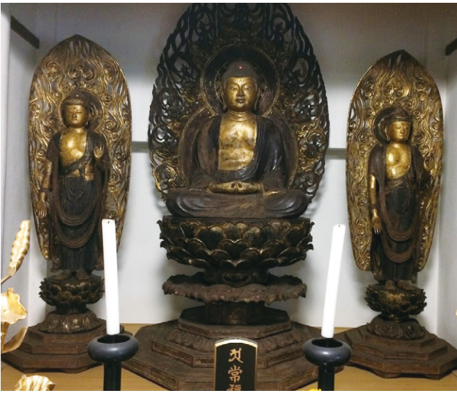
◆ 宝樹院阿弥陀三尊像

金沢区内大道にある宝樹院には、古い阿弥陀三尊像が安置されています。この仏像、その昔は宝樹院の山の下に江戸時代の末まで存続した常福寺の本尊です。常福寺は称名寺の末寺であり、室町時代に六浦の港から鎌倉へ通じる街道の要所に位置し、荒廃する称名寺の再建修理するために関所が設けられました。この仏像は12世紀後半頃の造立と考えられ、神奈川県重要文化財に指定されています。平成3年（1991）に仏像の解体修理が行われた際、弘安5年（1282）7月付の